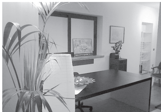
Uno spazio interno della sede della Cooperativa

migliore e più giusto, tentando di prevenire quell'angoscia per il domani di cui purtroppo sembra oggi pervaso il nostro tessuto sociale. Facendo allora propria la filosofia dell'autentico "Welfare", i soci fondatori hanno perciò cercato di costruire un impianto etico-solidale interamente privato, ma riconosciuto e sostenuto dall'Ente pubblico, appunto come dovrebbe avvenire secondo gli intenti collaborativi legiferati ad hoc , in merito alla regolamentazione dei rapporti tra pubblico e privato, attraverso i quali si pone al centro del sistema il bisogno della persona (e il diritto a stare bene!).