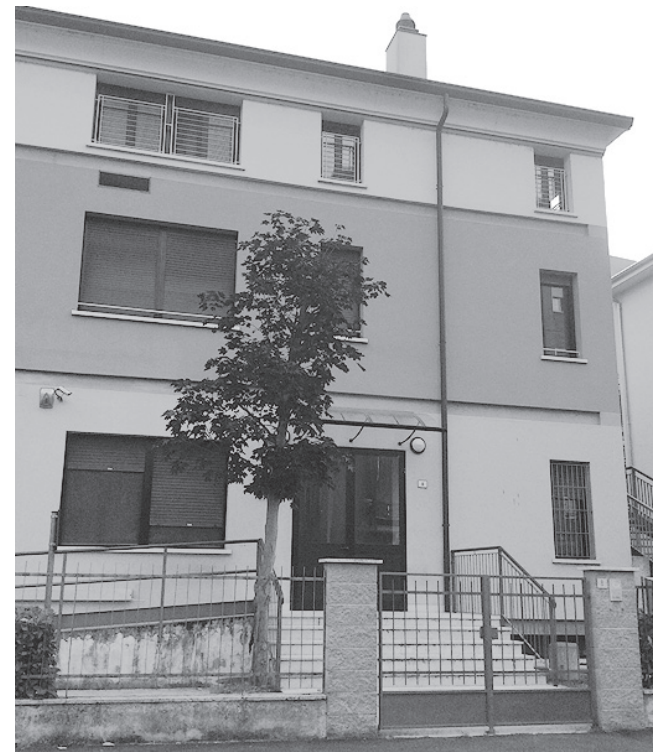
L'edificio di via Torelli che ospitava la Scuola dello Ial-Cisl, dove adesso verrà accolto il Centro di formazione della Cooperativa sociale "Mirabilia Hominis"

del 2012 a Porto Mantovano, è una società che si è strutturata nella forma della cooperativa sociale (naturalmente è stata riconosciuta come "Onlus", "Organizzazione non lucrativa di utilità sociale"), e i principi sui quali intende basare le proprie attività produttive, sono essenzialmente i seguenti: innovazione, formazione permanente, professionalità, trasparenza e legalità.